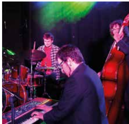
Urumea Blues&Jazz Festibala