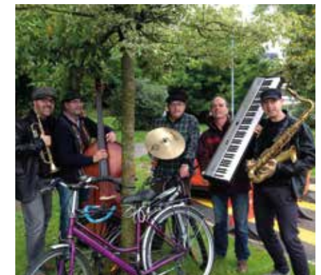
Tutti Frutti Jazz Project